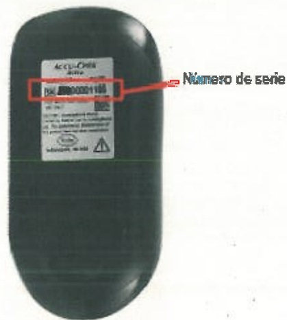
Figura 2: El número de serie puede encontrarse en la etiqueta adherida en la parte trasera de los medidores, como se muestra en la siguiente imagen: